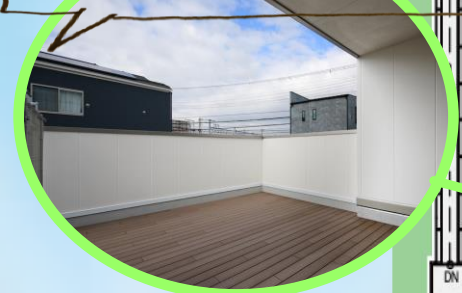
お日様を感じられるウッドテラス