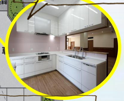
調理しながらも利用者さんの様子を感じられるキッチン