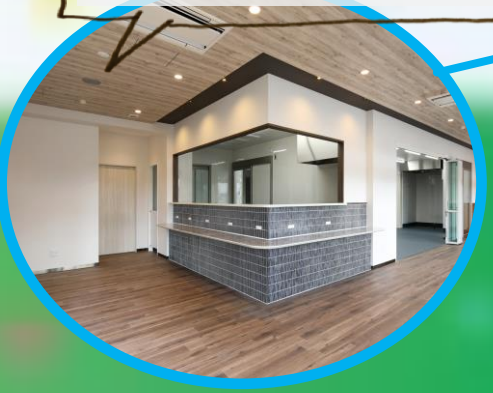
購入したパンを店内で飲食可能なスペース