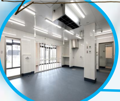
パン製造の様子が分かるゆとりあるパン工房