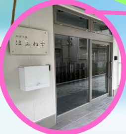
入口直結の相談室