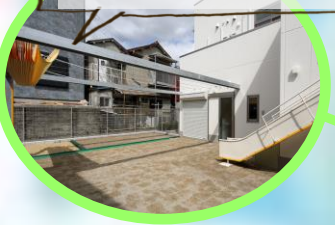
夏はココでプール遊び