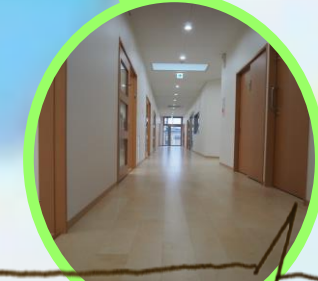
トップライト付きの約25メートルの廊下