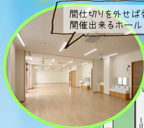
間仕切りを外せば発表会などが開催出来るホールになります