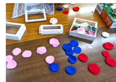
フラワーボックス

5月7日(土)の集まってみよう会では母の日のギフトボックスを作りました。一人ひとりメッセージカードに感謝の気持ちを書きました。